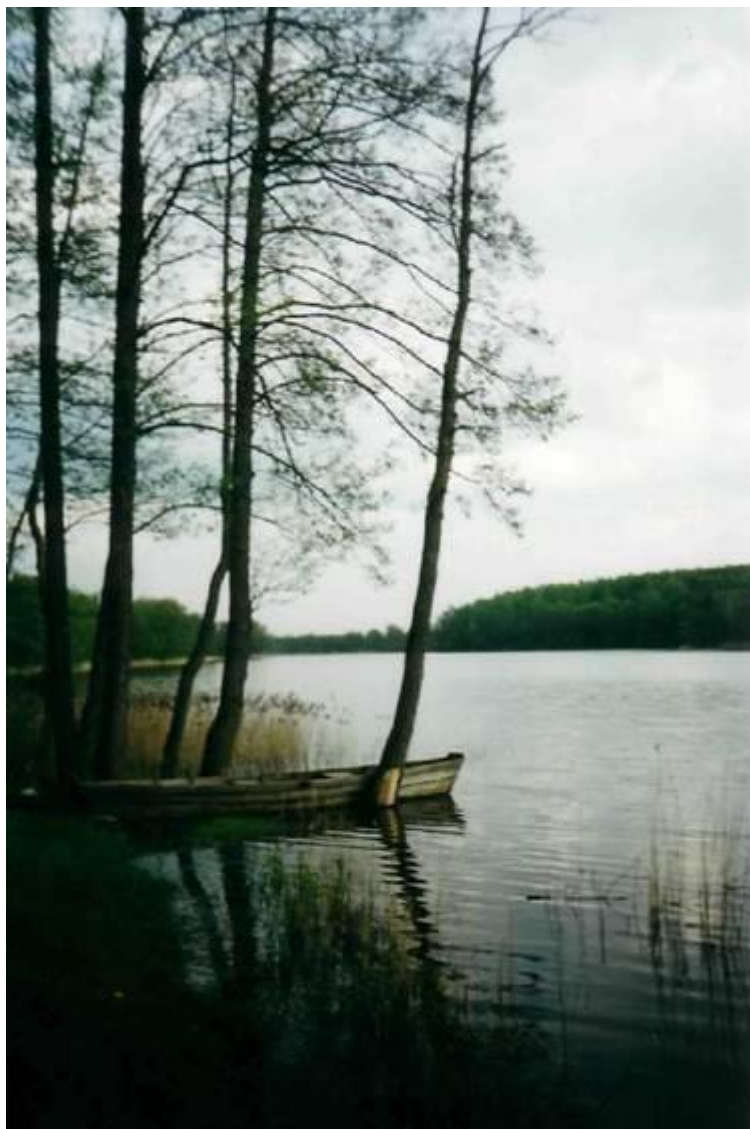
Ežeras Nosas 2001 m.