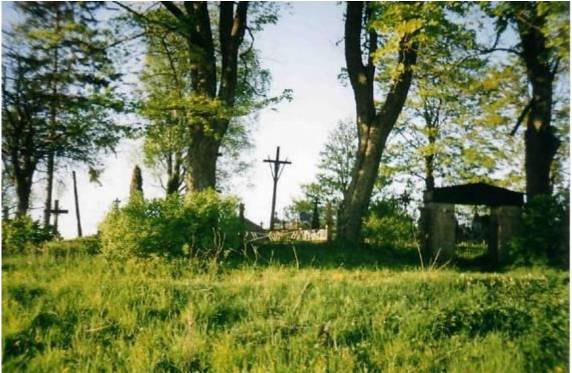
Užkalnių kaimo kapai 2001m.