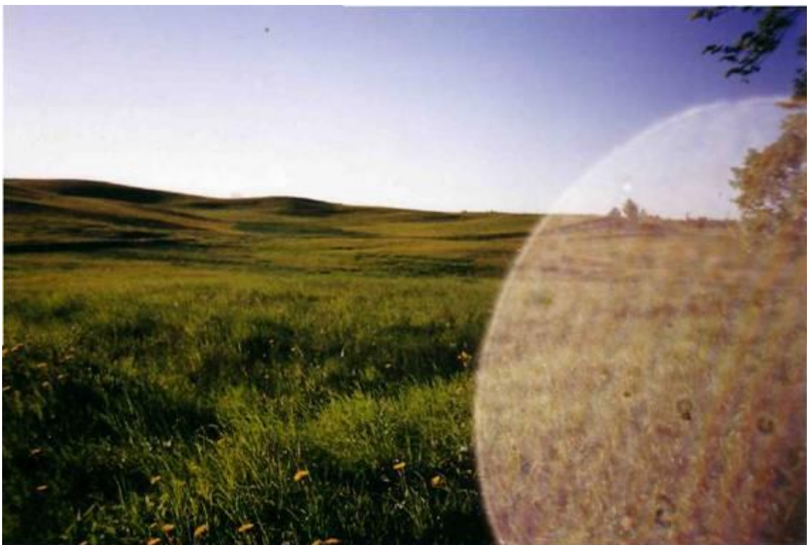
Kalnas Užukalnių kaime vadinamas Baronkalniu. Čia senovėje rodydavosi įvairūs vaiduokliai.