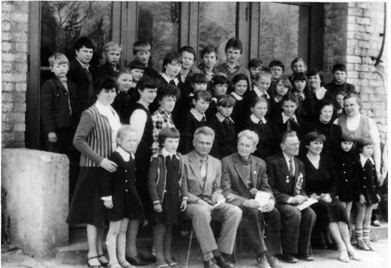
Junčionių mokyklos mokytojai