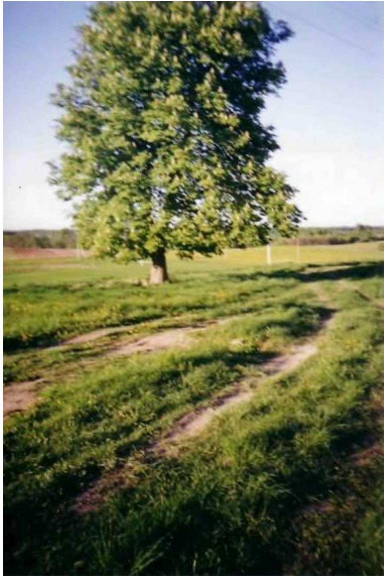
Kaimo viduryje augantis kaštonas, apie 60 metų, auga buvusioje Juozo Dabrovolso sodyboje