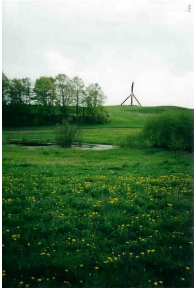
Užukalnių kaime esantis žemės žyminys [liaudyje vadinamas "majaku"]