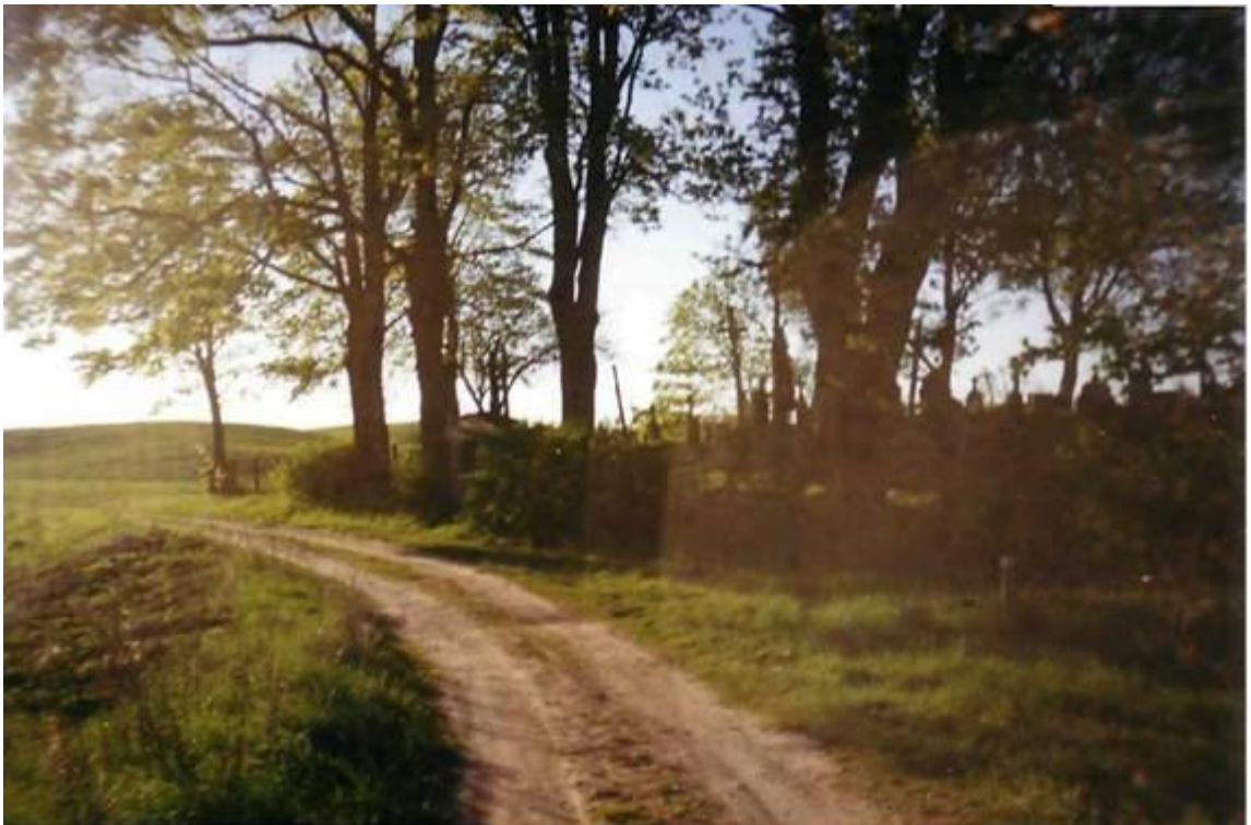
Užkalnių kaimo kapai 2001m.